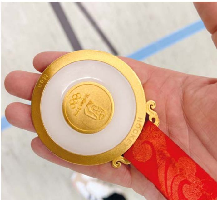
200 Gramm zum Anfassen: Hockey-Olympiasieger Sebastian Biederlack präsentiert bei der Kinder-Olympiade in der Sporthalle Voßhagen seine Olympia-Goldmedaille von 2008. Für viele Kinder ein besonderes Erlebnis.

Die Kinder-Olympiade in Rissen zeigt, wie viel Begeisterung Sport auslösen kann. Während der Parcours absolviert wird, stehen Bewegung, Gemeinschaft und der olympische Gedanke im Mittelpunkt. Gleichzeitig richtet sich der Blick auch in die Zukunft: auf eine mögliche Olympia-Bewerbung Hamburgs und darauf, Menschen langfristig für den Sport zu begeistern. mh