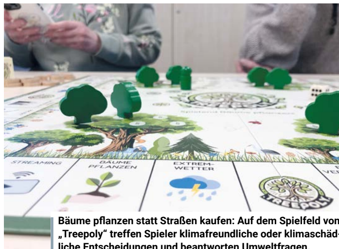
Bäume pflanzen statt Straßen kaufen: Auf dem Spielfeld von „Treepoly“ treffen Spieler klimafreundliche oder klimaschädliche Entscheidungen und beantworten Umweltfragen.

Mit Formaten wie diesem Spielevormittag wollen die Initiatoren zeigen, dass Klimaschutz nicht nur ein politisches Thema ist, sondern im Alltag beginnt – manchmal sogar mit einem Würfelwurf auf einem Spielbrett. mh