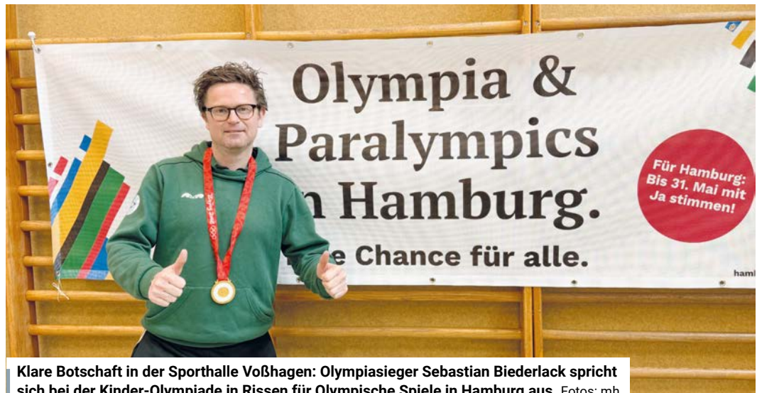
Klare Botschaft in der Sporthalle Voßhagen: Olympiasieger Sebastian Biederlack spricht sich bei der Kinder-Olympiade in Rissen für Olympische Spiele in Hamburg aus.

Außer dem sportlichen Ehrgeiz war in der Halle vor allem eines spürbar: Freude an Bewegung. Immer wieder wurde angefeuert und mitgefiebert, während der