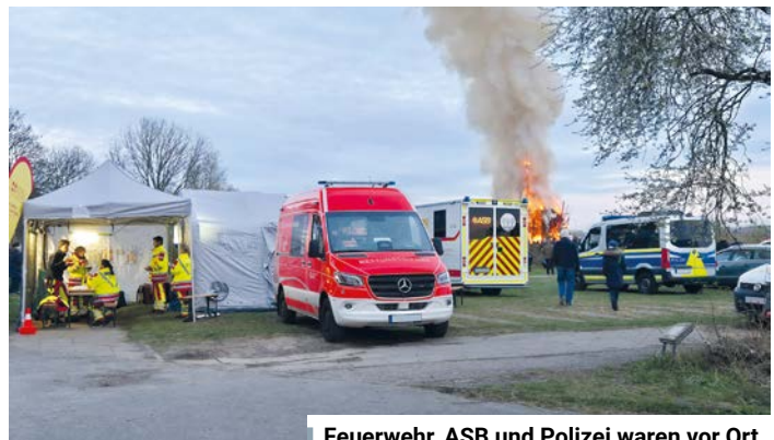
Feuerwehr, ASB und Polizei waren vor Ort.