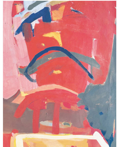
Britta Harder La Beauté & La Boutique