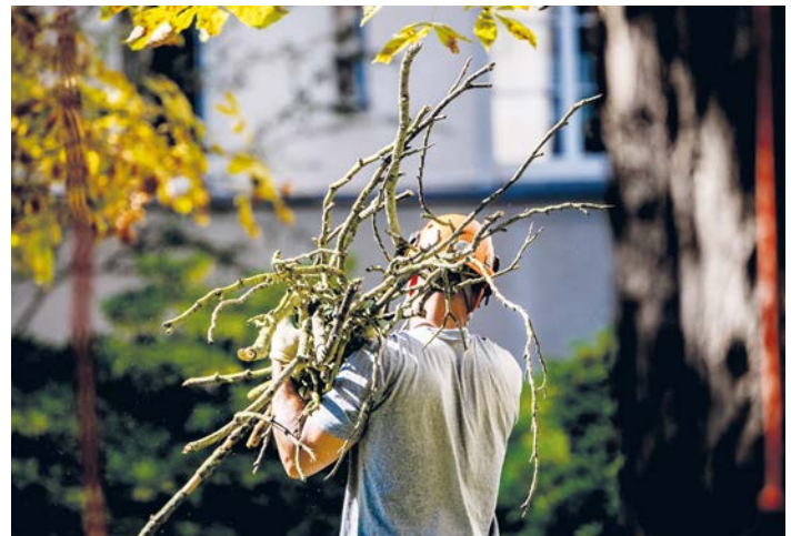
Profi für die Gartenarbeiten engagiert? Dann sollten zumindest Teile der Kosten steuerlich absetzbar sein.