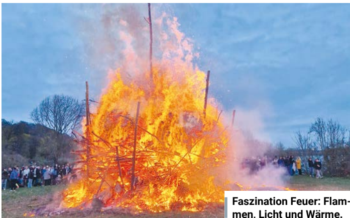
Faszination Feuer: Flammen, Licht und Wärme.

ist sowie der Arbeiter Samariter Bund (ASB) mit rund 50 ehrenamtlichen Einsatzkräften. An jeder Feuerstelle war eine Unfallhilfsstelle aufgebaut. Die Einsatzleitung befand sich auf dem Blankeneser Markt. ros