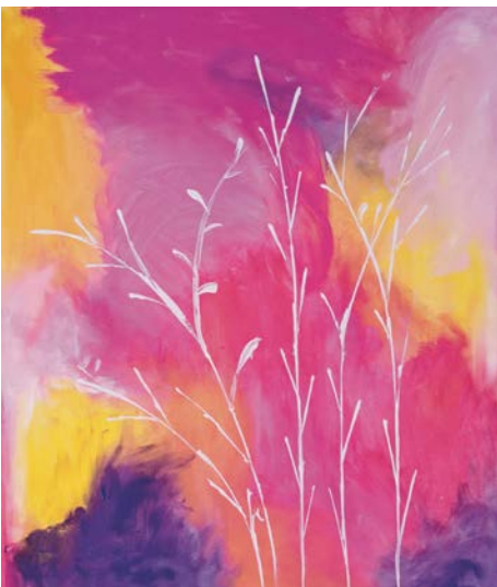
Astrid Brauer Nowak Immobilien