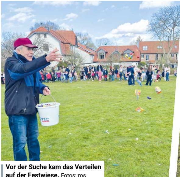
Vor der Suche kam das Verteilen auf der Festwiese.