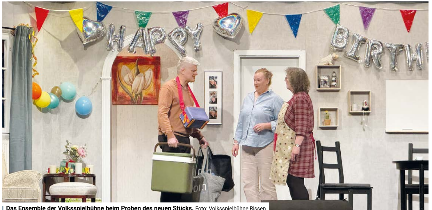
Das Ensemble der Volksspielbühne beim Proben des neuen Stücks.