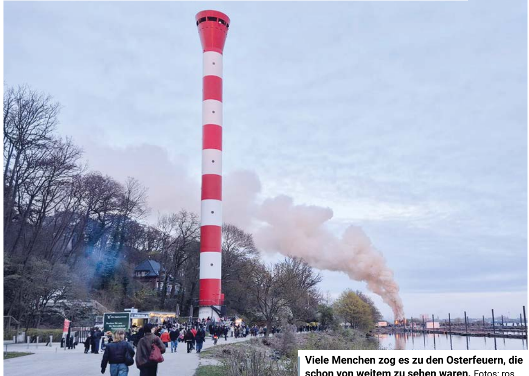
Viele Menchen zog es zu den Osterfeuern, die schon von weitem zu sehen waren.

Fünf Meter hoch und ein Durchmesser von acht Metern – so viel ist erlaubt bei den aufgeschichteten Brennholztürmen für das Osterfeuer. Karsonnabend haben die vielen Helferinnen und Helfer ab acht Uhr angefangen, aufzuschichten. Viele Engagierte sind schon in vierter Generation dabei. Die Wochen vor dem Ereignis geht es auf sogenannte „Knetetour“, denn das Osterfeuer wird privat finanziert: Gegen Spende holen die Aktiven Grünschnitt und gefällte Bäume zwischen Blankenese und Holm ab. Besonders Baumschulen und Bauern unterstützen die Osterfeuer tatkräftig mit Material und Spenden. Das Holz wurde Gründonnerstag und Karfreitag zur Elbe gebracht. 70 bis 80 Personen waren am Mühlenberg im Einsatz. Ein Team aus Menchen im Alter von vier bis zu Anfang sechzig Jahren. Sie sind hier