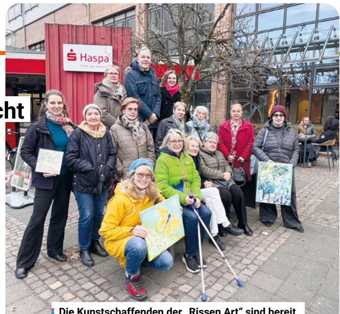
Die Kunstschaffenden der „Rissen Art“ sind bereit für Ausstellungen und Vernissage im Dorf.

Zu bewundern sind die Werke unter anderem entlang der Wedeler Landstraße und auch an der Straße Am Rissener Bahnhof sowie an der Rissener Dorfstraße in den Schaufenstern vom Weinhaus