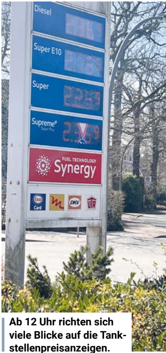
Ab 12 Uhr richten sich viele Blicke auf die Tankstellenpreisanzeigen.