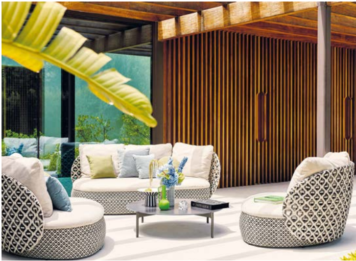
Elegantes Cremeweiß und Ivory: Helle Polsterfarben setzen 2026 moderne Akzente im Garten.