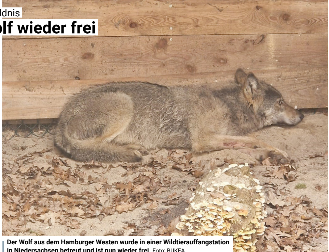
Der Wolf aus dem Hamburger Westen wurde in einer Wildtierauffangstation in Niedersachsen betreut und ist nun wieder frei.

Pro Jahr nimmt die Station etwa 3000 Tiere auf, darunter sowohl Fundtiere als auch Tiere aus diversen Beschlagnahmungen. Einige Arten werden mit einem Sender ausgestattet, um ihre Bewegungsprofile zu erfassen und zu erforschen. Dies geschieht beispielsweise bei Wildkatzen, Bussarden, Amseln und Igel. Und nun auch bei dem Wolf aus dem Hamburger Westen. Wie die Umweltbehörde mitteilt, wurde er am Ostersonntag mit einem Sender ausgestattet und in die Freiheit entlassen. Wo ge-