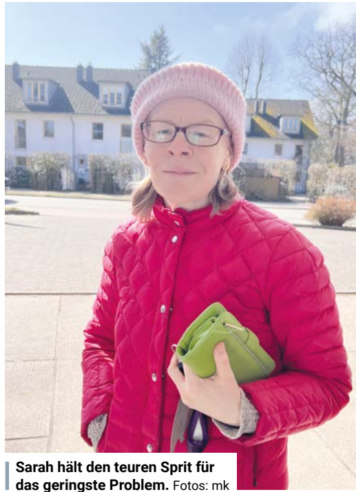
Sarah hält den teuren Sprit für das geringste Problem.