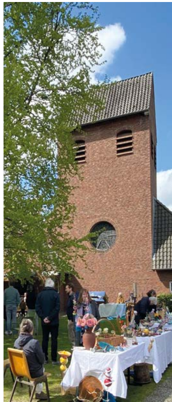
Die Ostermeile zieht immer viele Besucher an.

RISSEN. Die Johanneskirchengemeinde lädt für Sonntag, 12. April, wieder zur traditionellen Ostermeile rund um das Gemeindehaus und der Johanneskirche, am Raalandsweg, ein. Los geht es ab 11 Uhr, gleich nach dem Gottesdienst. Bis 15 Uhr können Besucher unter anderem Second-Hand-Schätze an Flohmarktständen ergattern. Anmeldungen sind auf der Homepage der Johannesgemeinde oder telefonisch/per E-Mail beim Netzwerk unter 040 81 9006 23 oder netzwerk@johannesgemeinde.de möglich. Ebenfalls bietet die Ostermeile viele Gelegenheiten, sich über die Arbeit der Gemeinde zu informieren, zum Beispiel über das Engagement der Tanzania-Gruppe. Für den kleinen Hunger zwischendurch gibt es Grillwürstchen, ein großes Salat-Angebot, selbstgebackene Kuchen, Kaffee und Getränke. Salat- und Kuchenspenden werden gerne angenommen. Alle Erlöse des Festes sind für die Nachbarschaftshilfe der Kirchengemeinde, das Johannes-Netzwerk, bestimmt. mk