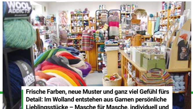
Frische Farben, neue Muster und ganz viel Gefühl fürs Detail: Im Wolland entstehen aus Garnen persönliche Lieblingsstücke – Masche für Masche, individuell und mit Freude am Selbermachen.

durch wechselhafte Tage und verbinden Komfort mit persönlichem Stil. Und wer bei Wolland von „KI“ hört, meint keine Technik, sondern genau das, was hier entsteht: kreative Ideen, die Form annehmen und dabei für entspannte Momente sorgen. Geöffnet ist auch am Ostersonntag, 4. April, von 9 Uhr an, bis 13 Uhr – perfekt, um sich selbst oder andere noch mit einem flauschigen Osterei zu überraschen.