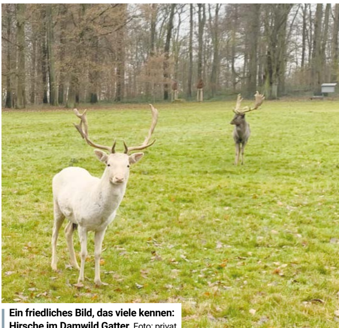
Ein friedliches Bild, das viele kennen: Hirsche im Damwild Gatter.