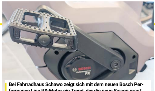
Bei Fahrradhaus Schawo zeigt sich mit dem neuen Bosch Performance Line PX-Motor ein Trend, der die neue Saison prägt: Technik, die nicht auffällt – sondern einfach funktioniert.