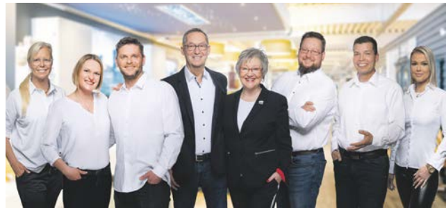
Individuelle Beratung in familiärer Atmosphäre