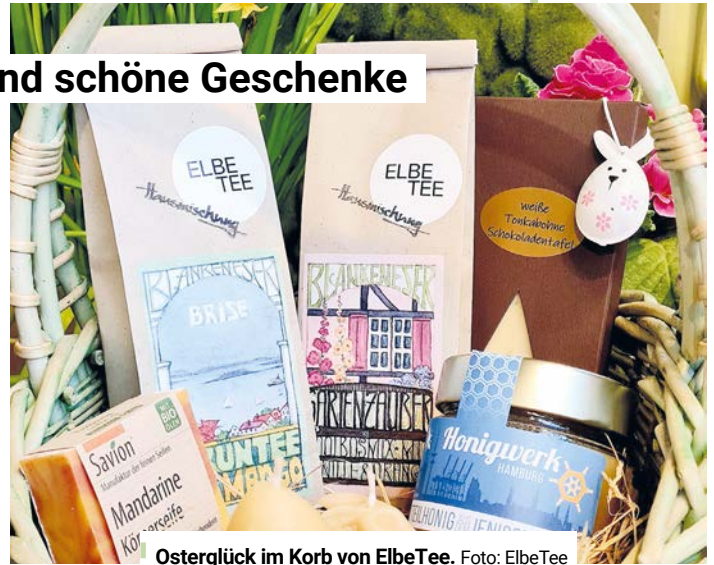
Osterglück im Korb von ElbeTee.

Gerade in der Osterzeit lohnt sich ein Besuch: Neue Frühlingsmischungen und inspirierende Kombinationen warten darauf, entdeckt zu werden. Wer Genuss, Qualität und eine besondere Atmosphäre schätzt, ist bei ElbeTee genau richtig.