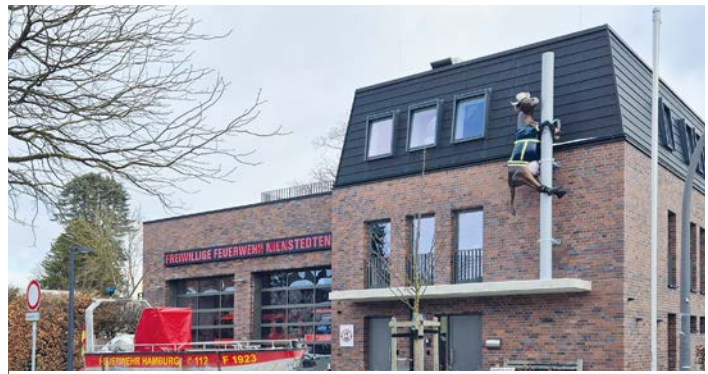
Die Wache hat sich in den vergangenen Jahren vergrößert. Deutlich zu sehen an der Fassade: die „Feuerwehrkuh“-Figur.

1993 hat sich ein sehr engagierter Förderverein gegründet. Mehr als 100 Mitglieder hat der Verein, der sich beispielweise für ein Kleinboot stark gemacht hat, das schnell und wendig auf der Elbe zum Einsatz kommen kann. Einige größere Spenden ermöglichten 2008 den Bau dieses Kleinbootes, womit sich die Sicherheitslage am und um den Anleger Teufelsbrück verbesserte. Wenn Boote für einen Einsatz auf der Elbe gebraucht werden, reicht das Gebiet der FF Nienstedten vom Hafengebiet/Landungsbrücken bis an die