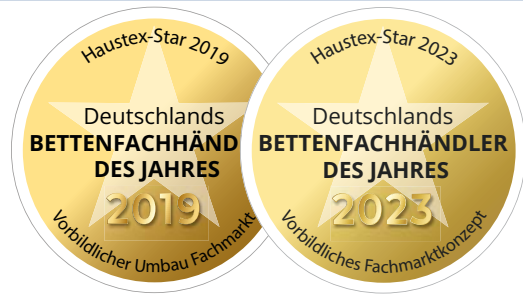
Deutschlands bestes Betten-Fachmarktkonzept

Wer regelmäßig mit Verspannungen aufwacht, nachts häufig die Position wechselt oder morgens nicht richtig erholt ist, sollte den Schlafplatz als mögliche Ursache in Betracht ziehen. Oft ist es nicht der Rücken, der das Problem ist, sondern die Unterlage, auf der er liegt.