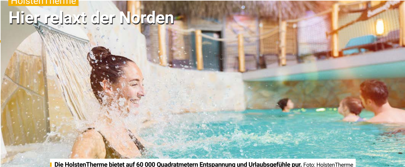
Die HolstenTherme bietet auf 60 000 Quadratmetern Entspannung und Urlaubsgefühle pur.

60 000 Quadratmeter Entspannung und Urlaubsgefühle pur: Die HolstenTherme, Norderstraße 8, in Kaltenkirchen, verwöhnt ihre Gäste mit Wasserspaß, Saunaglück und Wellness. Während draußen die Osterhasen durch kühle Frühlingsluft hoppeln, genießen die Gäste der HolstenTherme tropische 32 Grad Celsius in der WasserWelt. Innen- und Außenpools, KinderKaribik und Riesenrutschen sorgen für Spaß, während Ruhesuchende im Infinitypool, unter tropischem Regen und auf großzügigen Relaxflächen entspannen. Sportbecken und SoleRelaxpool bieten zusätzliche Möglichkeiten für Bewegung und Erholung. Für das leibliche Wohl sorgen die Bistros Havana und Bora Bora mit Snacks, Wok-Gerichten, Smoothies und Cocktails. In der SaunaWelt führt eine Reise