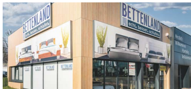
BETTENLAND in der Wohnmeile Halstenbek