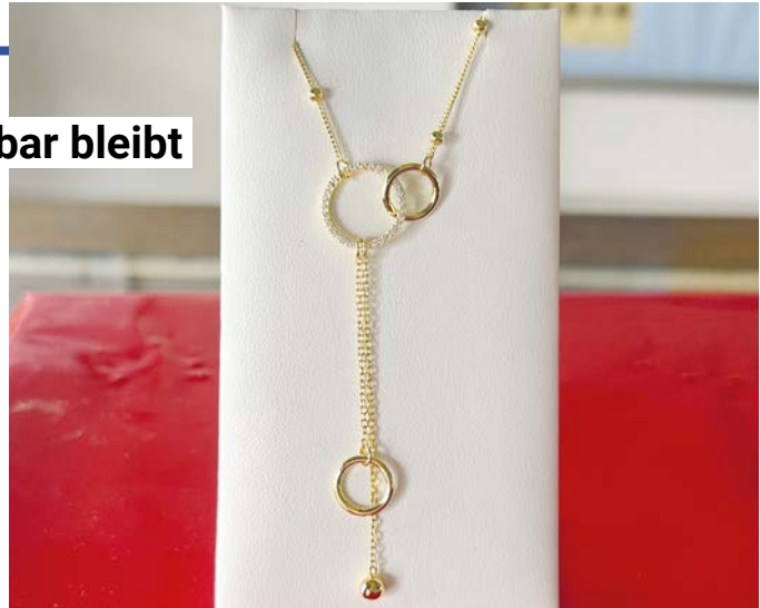
Ein Hauch von Gold und doch überraschend erschwinglich: Feine Colliers aus Silber, auf Wunsch vergoldet, setzen stilvolle Akzente im Osternest.